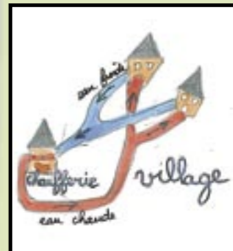
Le réseau de chaleur de Fraïsse dessiné par les enfants de l'école.

La première est une frise chronologique de l'utilisation du bois par l'homme depuis l'époque préhistorique à nos jours et la seconde présente la chaufferie et son fonctionnement.