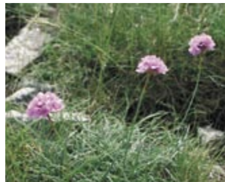
Armerie de Malinvaud ( Armeria malinvaudii ) plante protégée au niveau régional

L'objectif de cette étude est de faire un point précis sur le patrimoine naturel des communes de la CCMHL et des zones à forts enjeux patrimoniaux. Ces données seront à terme un remarquable outil d'aide à la décision et de gestion pour les élus et permettrons aux habitants de découvrir ou redécouvrir les richesses présentes sur leurs territoires.